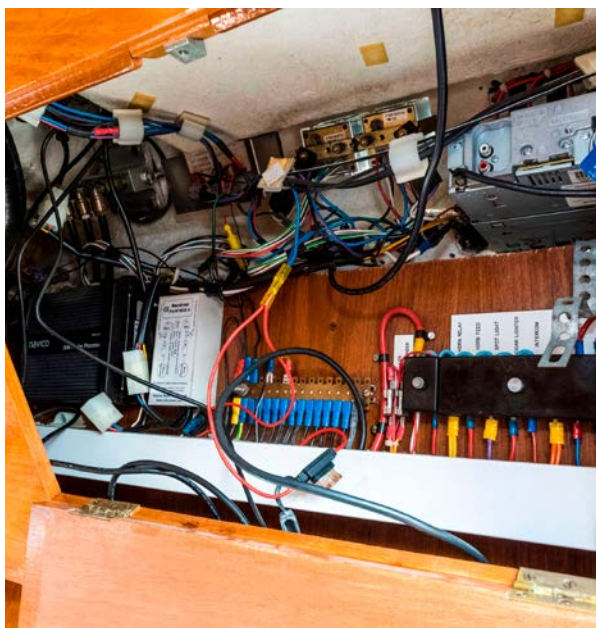
ETTERSE DET ELEKTRISKE ANLEGGET OM BORD. Er sikringene riktig dimensjonert? Hvordan ser kablene ut? Er det ryddig – eller kaos. Feil i elektrisk anlegg er ofte årsak til en båtbrann.