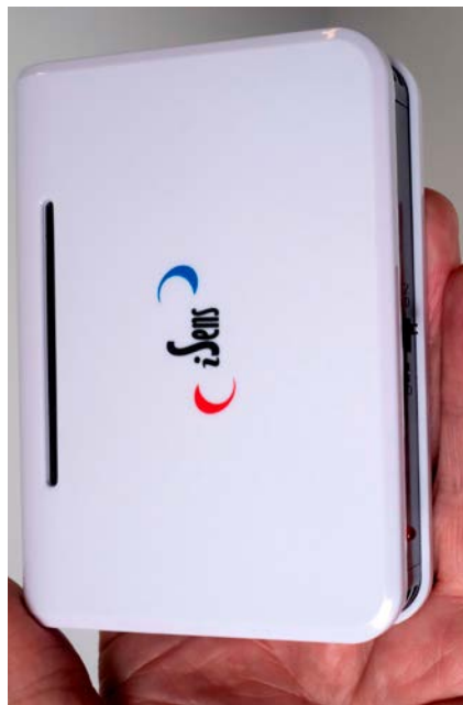
SØRG FOR VARSLING! Dette er en multigas-salarm som reagerer på propan, butan, røyk, kullos (CO), karbondioksid (CO 2 ) og narkosegasser.