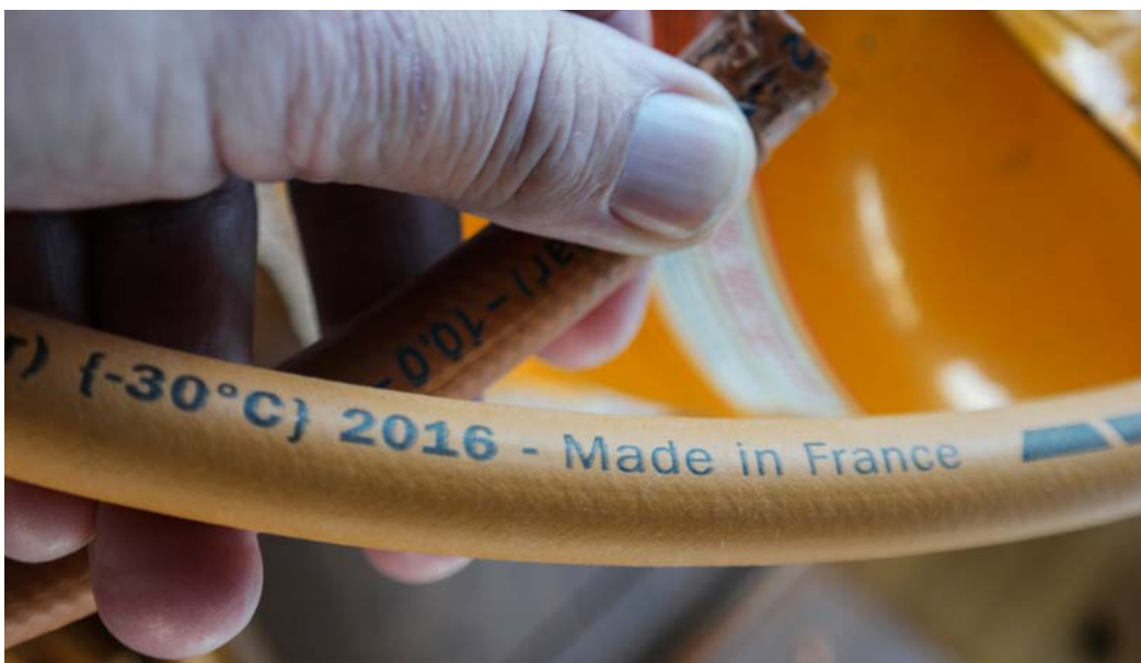
HAR DU GASSANLEGG OM BORD skal dette sjekkes av fagfolk minimum hvert femte år. Du kan også ta en mellom-sjekk selv.